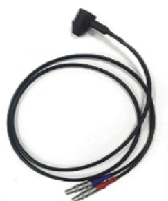
双晶聚酰亚胺探头10A6